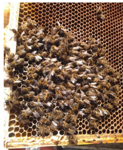
Kuvassa on tyypillinen punkin aiheuttamaan virustautiin kuollut yhteiskunta. Pesä on lähes tyhjä mehiläisistä. Viimeiset yksilöt ovat sinnitelleet hengissä, kunnes tavoitettavissa oleva ruoka on loppunut. Yleensä mehiläisten keskeltä löytyy myös kuningatar, ja keskemällä kehää voi olla myös jonkin verran peittosikiöitä.