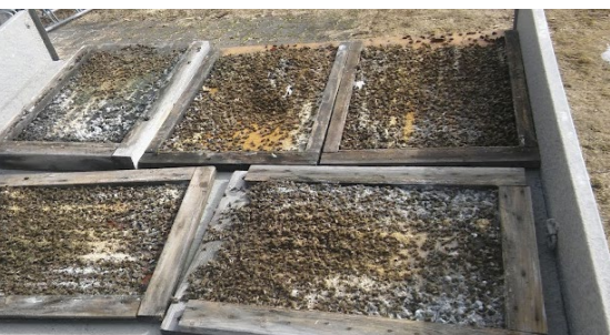
Ensimmäisiä keväisiä hoitotoimia on pohjien vaihtaminen ja puhdistaminen. Kuolleet mehiläiset makeine pohjamoskineen on syytä tuoda pois tarhalta. Muutoin ne houkuttelevat paikalle muurahaisia ja pahimmissa tapauksessa myös karhuja.