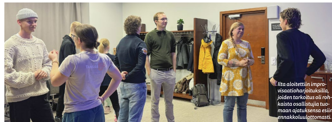
Ilta aloitettiin improvisaatioharjoituksilla, joiden tarkoitus oli rohkaista osallistujia tuomaan ajatuksensa esiin ennakkoluulottomasti.

TEKSTI ANNA-MARIA BORSHAGOVSKI