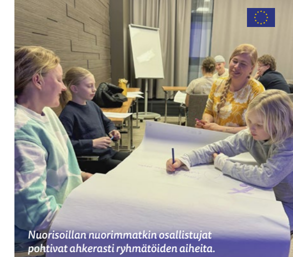
Nuorisoillan nuorimmatkin osallistajat pohtivat ahkerasti ryhmätöiden aiheita.

Työpajan pohdintoissa nousi useamman kerran esiin mehiläisalan näkyvyys ja alan herättämät mielikuvat, joissa tarhaajat eivät todellakaan ole nuoria. Näitä