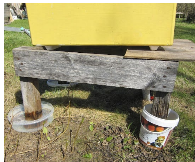
▼ Vallihautatyypinen vesieste toimii myös muurahaisten häätämiseen. Toiset laittavat astioihin öljyä, mutta öljy saattaa tulla rankkasateella ulos astiasta, ja se ei ole ympäristön kannalta hyvä asia.