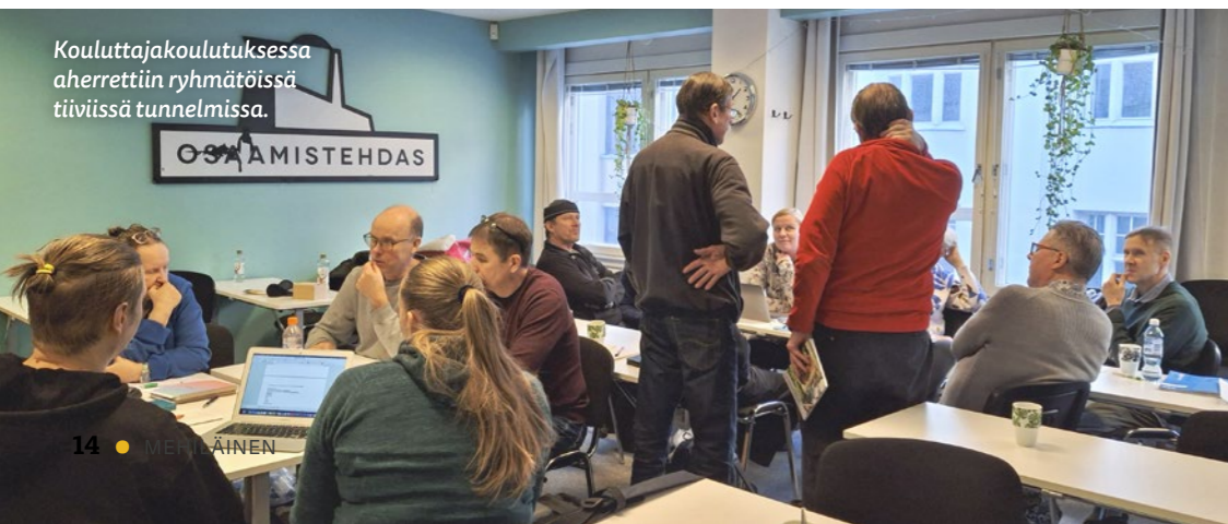
Kouluttajakoulutuksessa aherrettiin ryhmätöissä tiiviissä tunnelmissa.