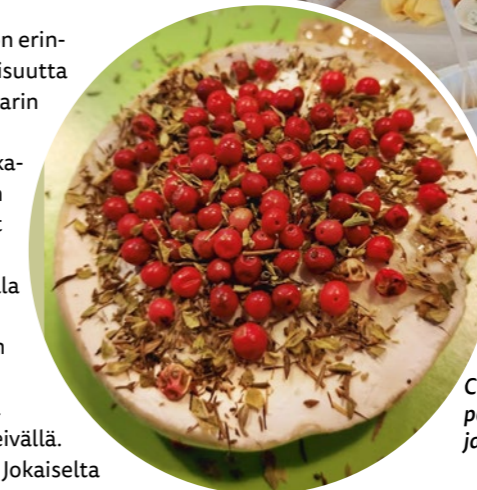
Chèvre menossa uuniin, päällä hunajaa, rosépippuria ja yrttimausteita.