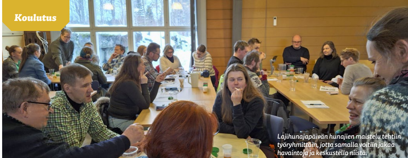
Lajihunajapäivän hunajien maistelu tehtiin työryhmittäin, jotta samalla voitiin jakaa havaintoja ja keskustella niistä.