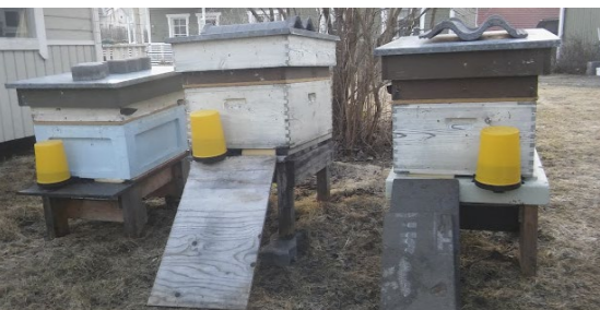
Sikiöinnin alkaessa ruuankulutus pesissä lisääntyy merkittävästi. Puhdistuslennon jälkeen pesille voi antaa lisäruuaksi 50-prosenttista sokerilientä vaikkapa kuvan kaltaisilla, lentoaukulle sijoitettavilla ruokintalaitteilla.

Mikäli tarhallasi sattuu karhuvahinko, maaseutuasiamiehen tulee tarkastaa vahinko, jotta siitä voi saada korvauksen. Mikäli et tavoita maaseutuasiamiestä välittömästi, tee heti vahinkopäivänä vahinkoilmoitus Ruokaviraston VIPU-palvelussa.