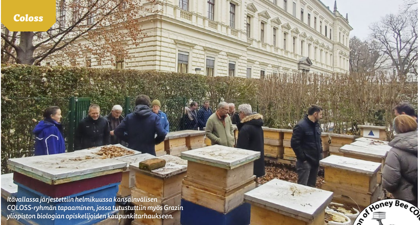
Itävallassa järjestettiin helmikuussa kansainvälisen COLOSS-ryhmän tapaaminen, jossa tutustuttiin myös Grazin yliopiston biologian opiskelijoiden kaupunkitarhaukseen.