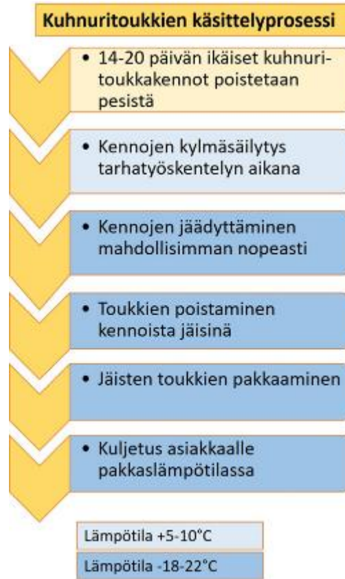
Kuva 3. Kuhnuritoukkien käsittelyprosessi

Kuhnuritoukkia voidaan syödä myös kypsentämättöminä, mutta ruokaturvallisuuden takia kuumentamista suositellaan ennen käyttöä. Hyönteisten kylmäkuivauksessa voivat pitkäketjuiset rasvahapot hapettua, jolloin syntyy sivumakuja ja outoa tuoksua. Peitettyjen toukkien bakteri-pitoisuuksista ei löydy tutkimuksia.