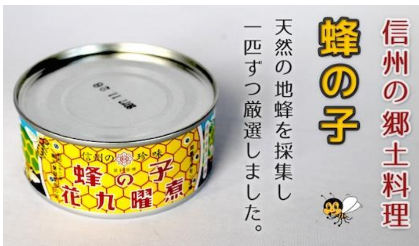
Kuva 1. Hachinoko-säilyke

Kirjallisuuden perusteella on vaikea päätellä, käytetäänkö mehiläistoukkia missään pääasiallisena valkuaisravintona. Enemmän mainintoja on ”hunajanmetsästäjistä” – siis villoista mehiläispesistä hunajaa keräävistä alkuperäiskansoista – jotka nauttivat mehiläistoukkia eräänlaisena herkullisena palkintona hunajametsästyksen jälkeen. Mainintoja on myös toukkatuotteiden markkinoinnista paikallisilla hunajatuotemarkkinoilla Aasian maissa (2, 4). Mehiläisten toukat ovat yksi lupaava ravinnon lähde, koska mehiläisiä kasvatetaan lähes joka puolella maapalloa. Monissa kulttuureissa niitä syödään jo herkkuna. Seuraavilla alueilla mehiläistoukkia käytetään yleisesti: Meksiko, Ecuador, Kiina, Thaimaa, Senegal, Zambia, ja Australia. Mehiläistoukkia pidetään sekä ravintorikkaina, hyvän makuisina että monella tapaa hyödynnettävinä. (3) Länsimaissa toukkatuotteita (lähinnä säilykkeitä) myydään vain satunnaisesti joissakin itämaisen ravinnon liikkeissä. Yksi netin välityksellä löytyvä tuote on japanilainen Hachinoko, mehiläistoukista tehty ruoka tai säilyke, jonka raaka-aineena on mehiläistoukkia, sokeria ja soijakastiketta.